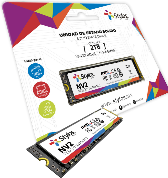
Imagen solo para fines ilustrativos/ Image for illustrative purposes only