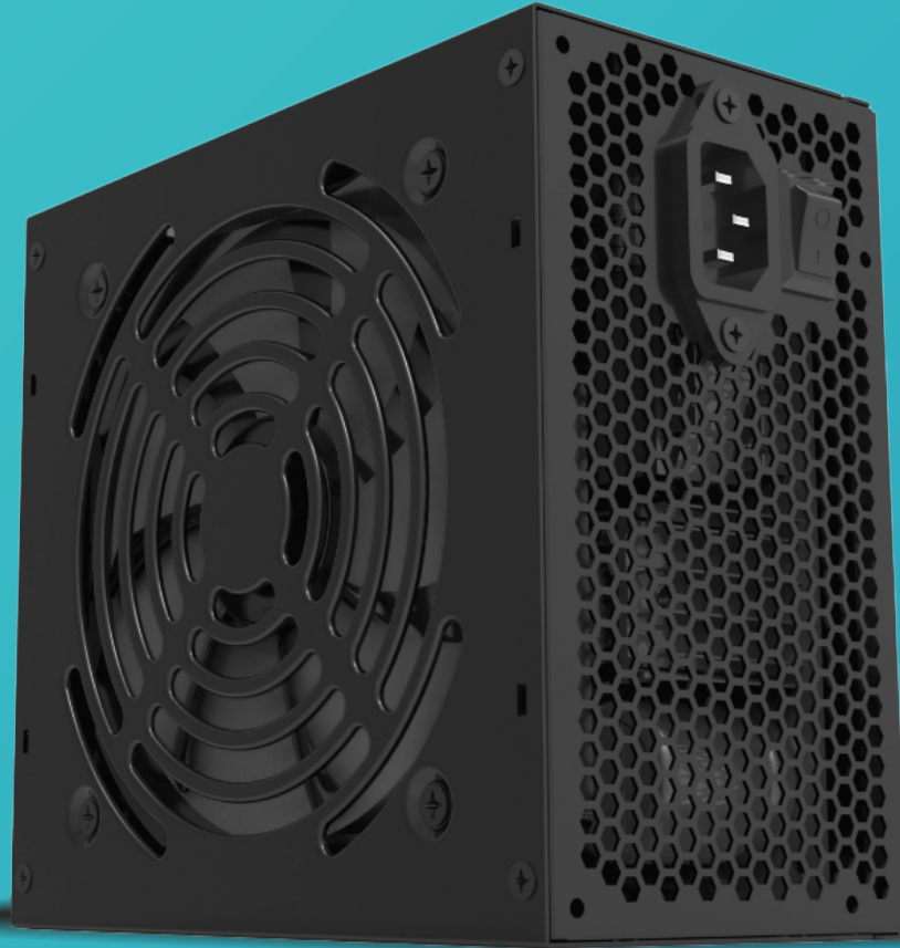
Imagen solo para fines ilustrativos/ Image for illustrative purposes only