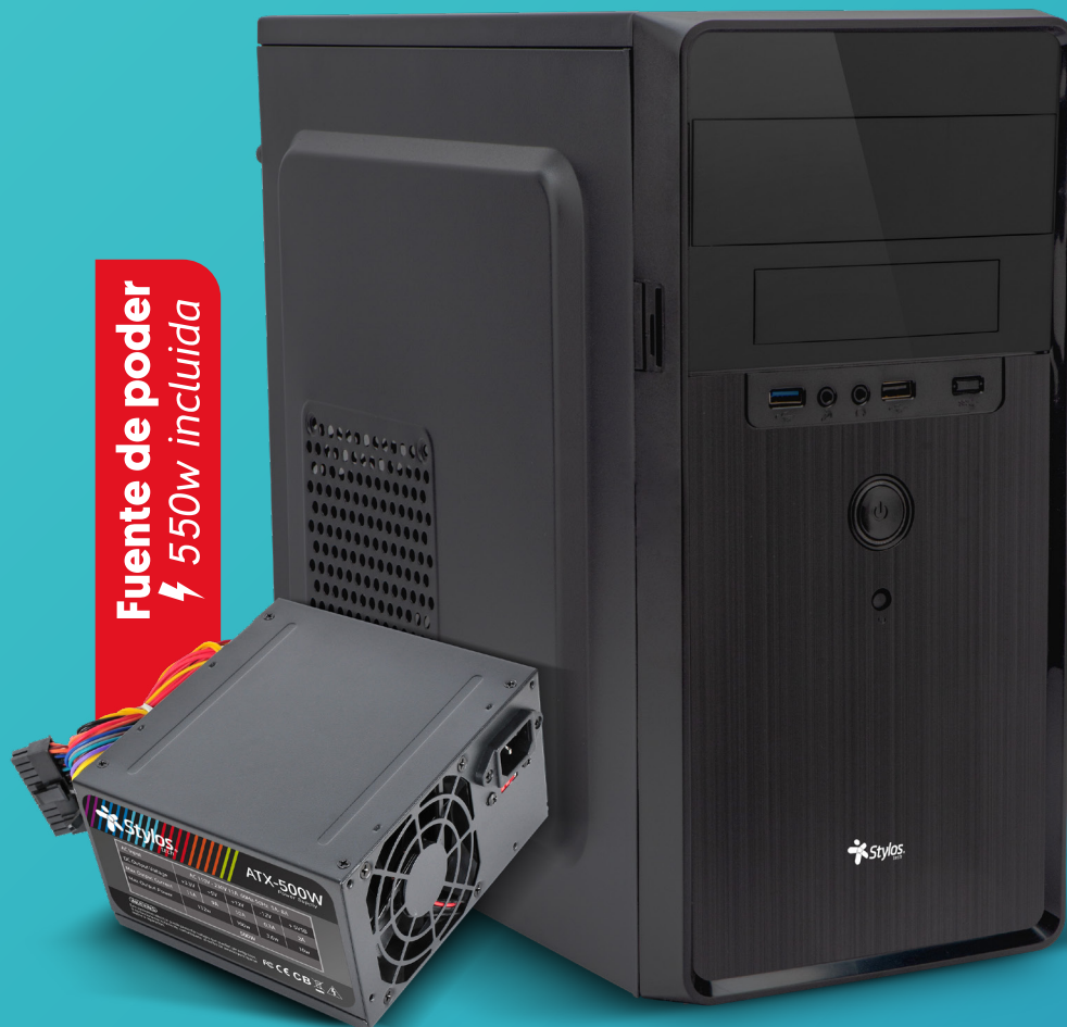
Imagen solo para fines ilustrativos/ Image for illustrative purposes only

El gabinete Micro ATX combina un diseño contemporáneo y funcional que se adapta sin esfuerzo a cualquier entorno de trabajo. Su estética moderna y su factor de forma permiten una distribución eficiente del espacio, ideal para oficinas donde optimizan lo esencial.