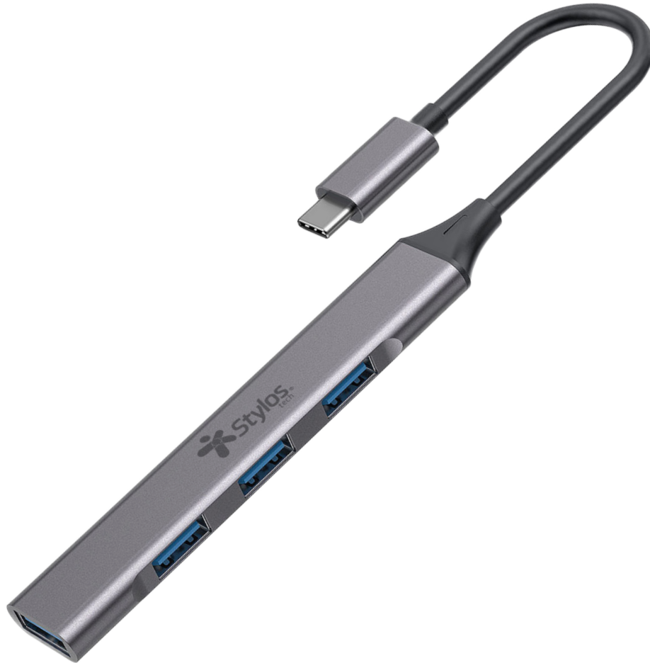
Imagen solo para fines ilustrativos/ Image for illustrative purposes only